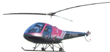
F 28 F